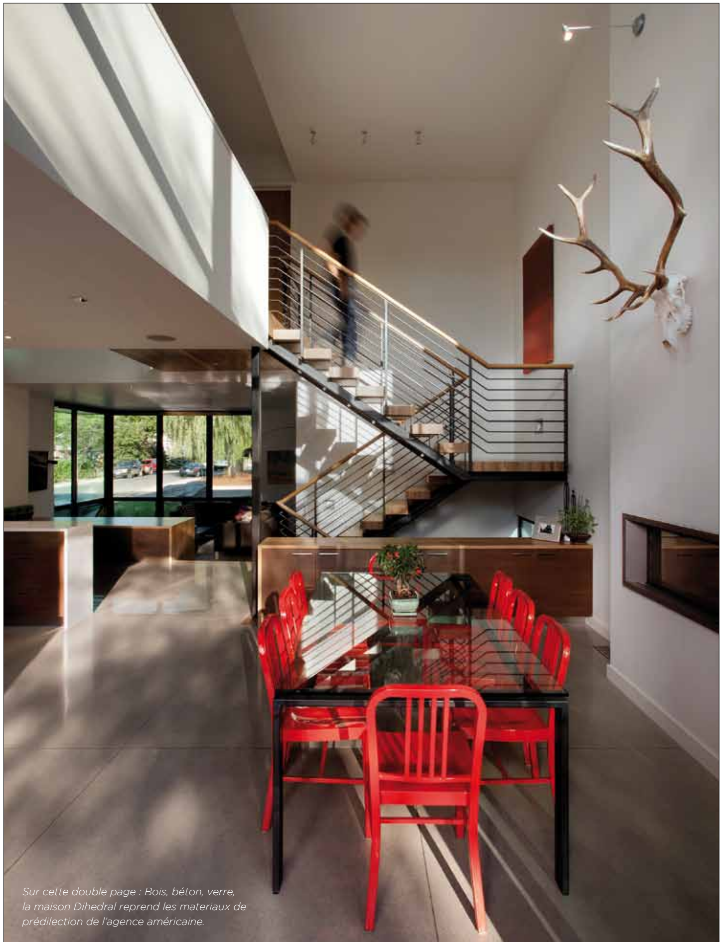
Sur cette double page : Bois, béton, verre, la maison Dihedral reprend les matériaux de prédilection de l'agence américaine.